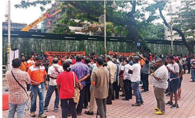
兴权会要求希盟政府实践大选竞选宣言。