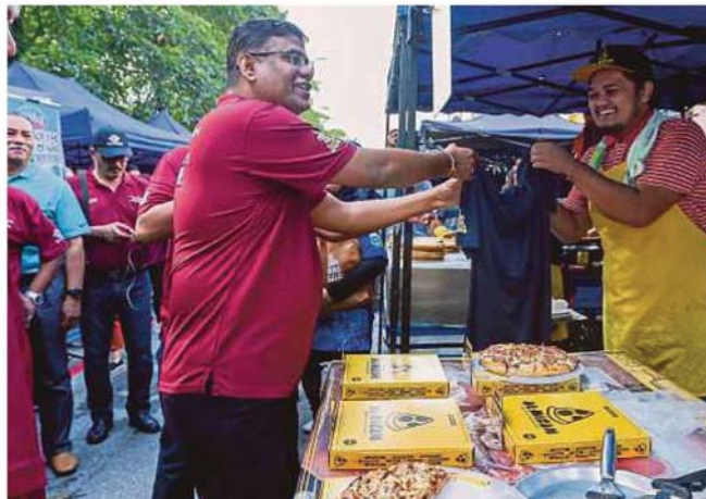
GANABATIRAU menyerahkan sumbangan selepas melancarkan Bazar Prihatin Selangor Pasar Muhibbah Tunesel Putra Heights, semalam.

li Dewan Undangan Negeri (Adun) Kota Kemuning berkata, dalam usaha membasmi perkara itu, perlu kepada penguatkuasaan secara bersepadu.