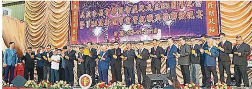
瓜冷中華商會第24屆新理事在(左一)的監督下,宣誓就職。

(万津24日讯)瓜拉冷岳中华商会日前举办庆祝成立53周年暨第24届新理事宣誓就职典礼“双喜”联欢晚宴,筵开115席,场面热闹。