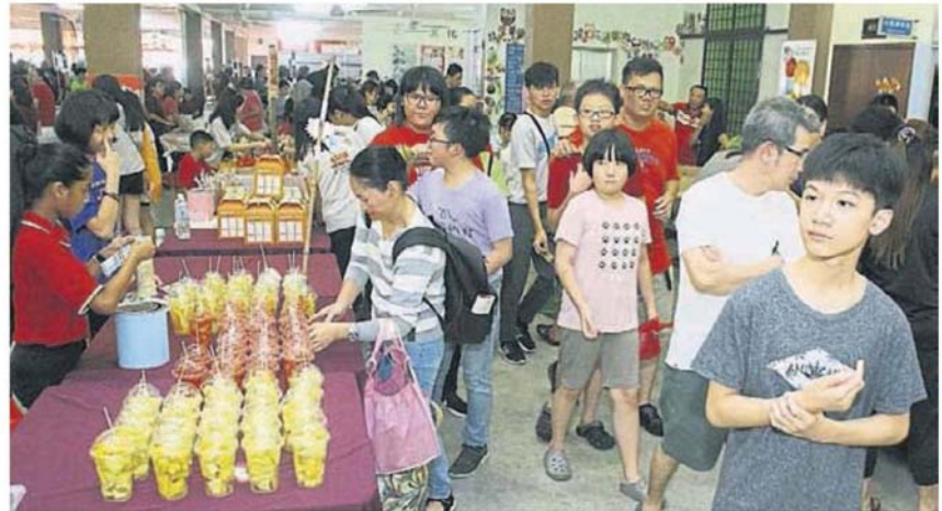
■“得胜建设家苑”义卖会吸引许多民众踊跃出席，现场人潮攒动。

“得胜建设家苑”义卖会时说，目前该协会仍在等待加影市议会批准建筑图测，一旦获得批准即可著手展开兴建工程。