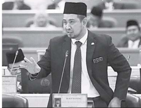
柔佛州务大臣萨鲁丁嘉玛。