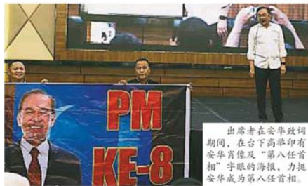
出席者在安華致詞期間，在台下高舉印有安華肖像及“第八任首相”字眼的海報，力挺安華成為第八任首相。