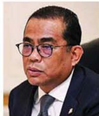
卡立诺丁吁请巫统议员，坚守身为反对党的角色。

“巫统国会议员目前唯一必须做的，就是扮演好反对党的监督角色。扮演好适当的制衡角色，必定能够说服人民，巫统能成为向前迈进的政党。”#