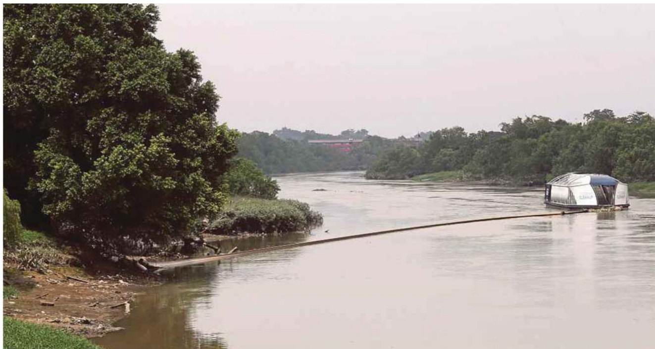
The river cleaning unit from The Ocean Cleanup docked near the Klang Municipal Council.