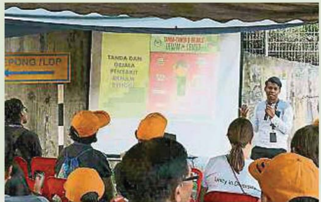
泗岩沫卫生部官员向居民讲解灭蚊的有效方法。

同时，泗岩沫区卫生局也派代表现场讲解蚊子的繁殖，包括如何分阶段生长和消灭蚊子的有效方法等，让居